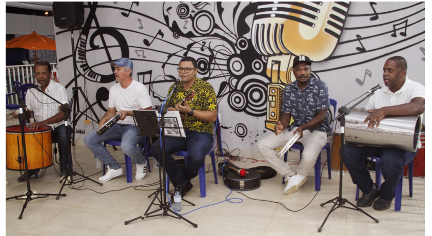
Grupo de pagode "Tirando uma onda"

As sextas musicais estão de volta no Clube Social. Quinzenalmente, associados, familiares e convidados podem se divertir nas dependências do clube de lazer e aproveitar um delicioso happy hour na lanchonete com música ao vivo a partir das 19 horas, além de porções saborosas e bebidas geladinhas por um valor bem acessível. A programação é divulgada com antecedência nas redes sociais do Sindicato. Programe-se e venha se divertir conosco!