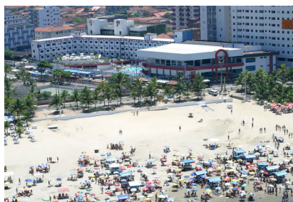
CENTRO DE LAZER EM PRAIA GRANDE