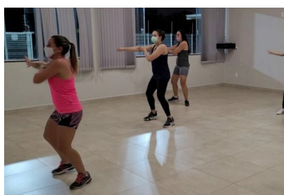
AULAS DE DANÇA