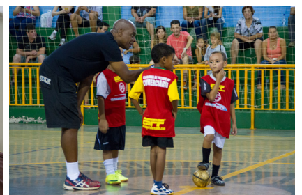
ESCOLINHA DE FUTSAL