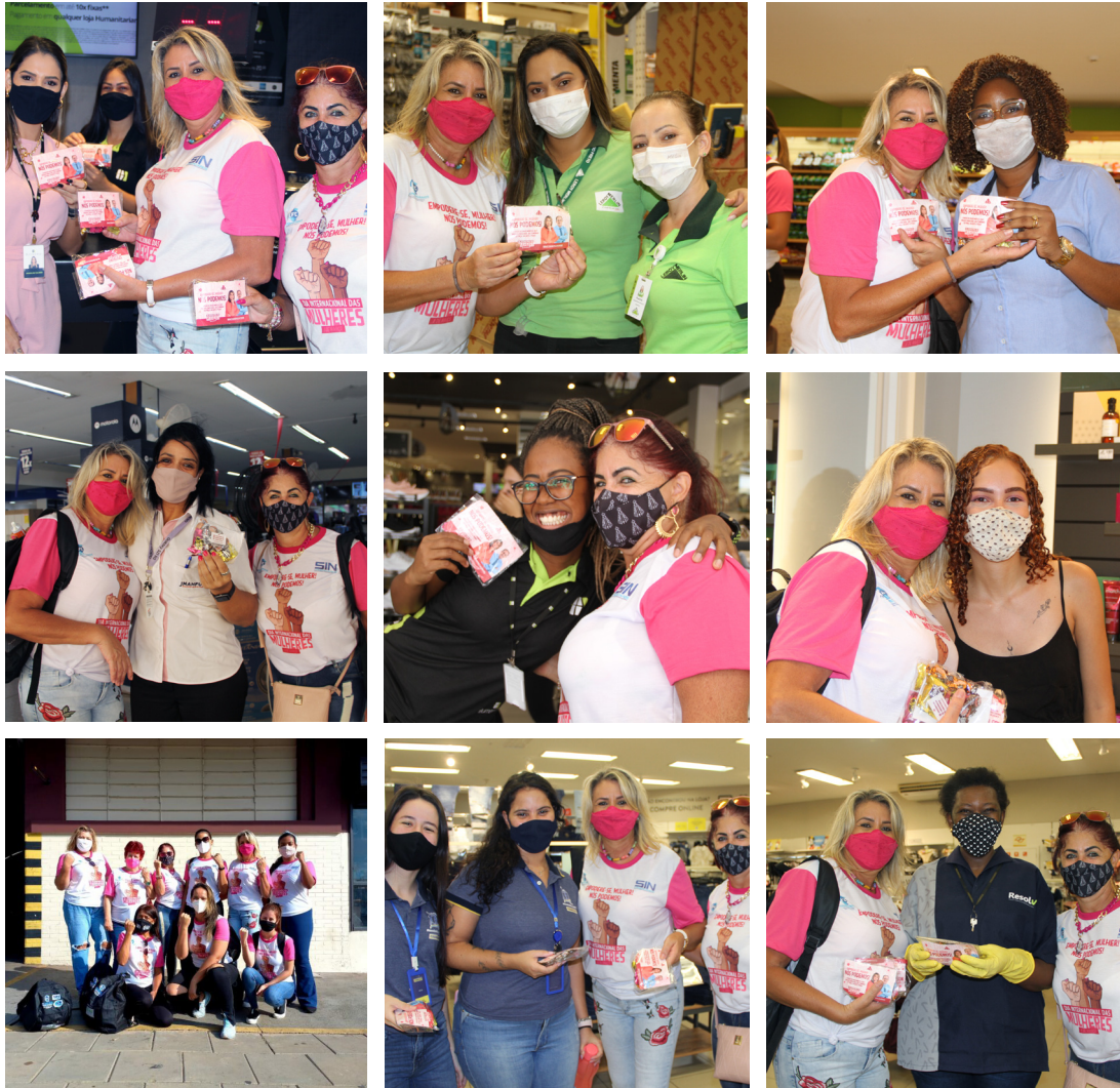
Diretoras e funcionárias entregaram bombons nos estabelecimentos comerciais centrais

FORAM CONTEMPLADAS TRÊS MIL TRABALHADORAS