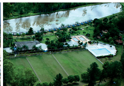
CLUBE DE CAMPO