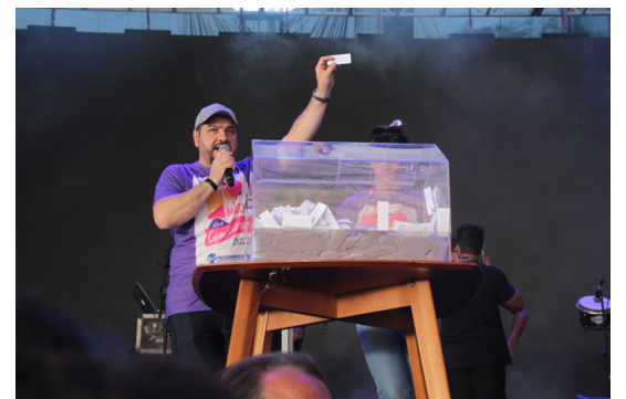
Grandes momentos marcaram a Dia do Trabalhador em Avaré. Confira as imagens acima