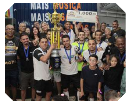
Eurotech 5 - campeão série ouro