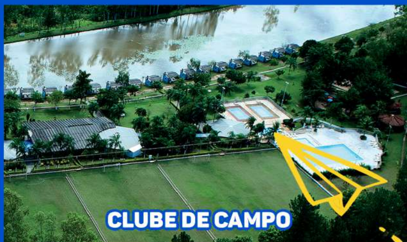
CLUBE DE CAMPO