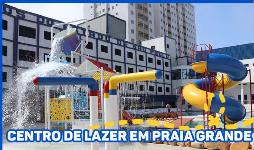
CENTRO DE LAZER EM PRAIA GRANDE