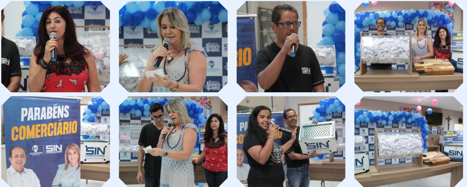
A live-sorteio foi realizada no Centro de Benefícios às vésperas do "Dia do Comerciário"

Em comemoração ao Dia do Comerciário (30/10), o Sincomerciários realizou no mês de outubro uma live-sorteio com o "Show de Prêmios". Os trabalhadores sindicalizados com carteirinha em dia concorreram a diversos prêmios como: kit-churrasco, vales-compra no valor de R$ 200,00 e churrasqueira. Ao todo, foram contemplados cerca de 45 trabalhadores de Rio Preto e região.