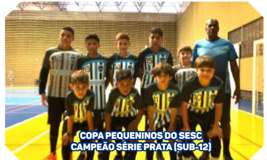
COPA PEQUENININOS DO SESC CAMPEÃO SÉRIE PRATA (SUB-12)