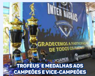
TROFÉUS E MEDALHAS AOS CAMPEÕES E VICE-CAMPEÕES