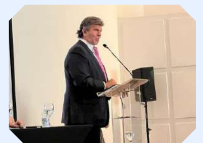
Equipe jurídica do Sincomercários prestigiou o evento realizado em Campinas