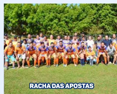
RACHA DAS APOSTAS