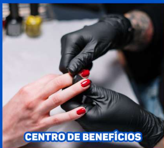
CENTRO DE BENEFÍCIOS