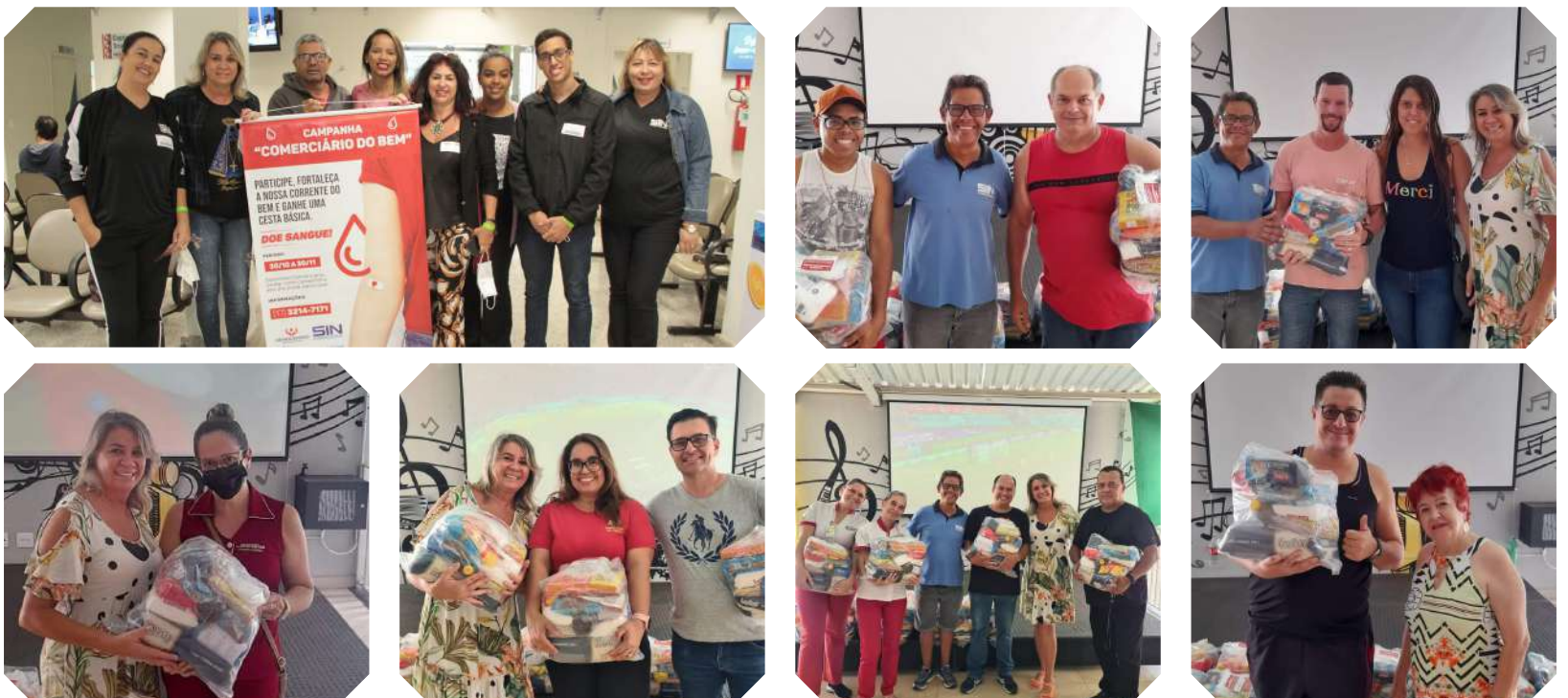
Comerciários doadores retiraram a cesta básica no Clube Social

Mais de 150 comerciários titulares doaram o seu sangue em prol a nossa campanha "Comerciário do Bem" em parceria com o Hemocentro no mês de novembro. Os trabalhadores que participaram ganharam uma cesta básica do Sindicato em reconhecimento ao gesto solidário e ao Dia do Comerciário.