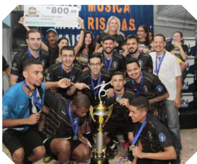
Belvedere - campeão série prata