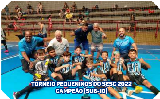
TORNEIO PEQUENININOS DO SESC 2022 CAMPEÃO (SUB-10)