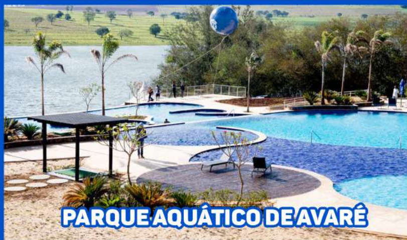
PARQUE AQUÁTICO DE AVARÉ