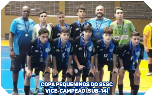
COPA PEQUENININOS DO SESC VICE-CAMPEÃO (SUB-14)