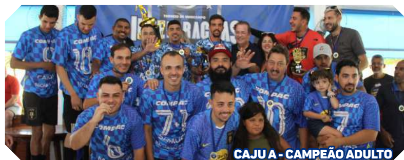
CAJU A - CAMPEÃO ADULTO