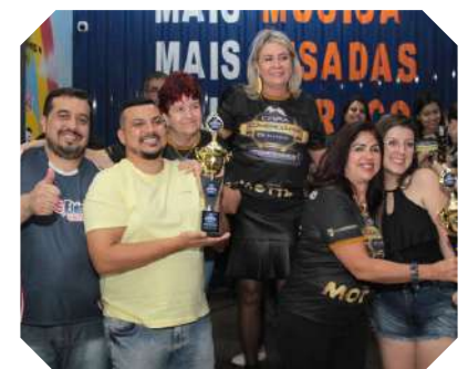
Torcidas mais animadas Multi Elétrica e Rei dos Parafusos