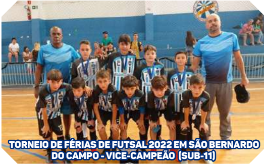
TORNEIO DE FÉRIAS DE FUTSAL 2022 EM SÃO BERNARDO DO CAMPO - VICE-CAMPEÃO (SUB-11)