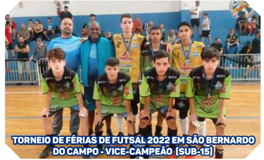
TORNEIO DE FÉRIAS DE FUTSAL 2022 EM SÃO BERNARDO DO CAMPO - VICE-CAMPEÃO (SUB-15)