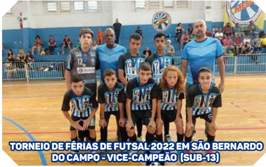
TORNEIO DE FÉRIAS DE FUTSAL 2022 EM SÃO BERNARDO DO CAMPO - VICE-CAMPEÃO (SUB-13)