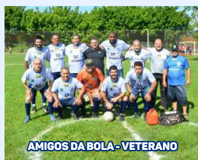
AMIGOS DA BOLA - VETERANO