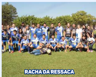
RACHA DA RESSACA