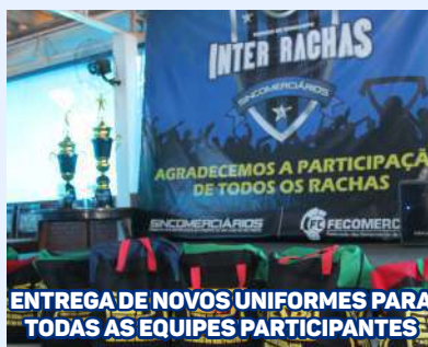
ENTREGA DE NOVOS UNIFORMES PARA TODAS AS EQUIPES PARTICIPANTES