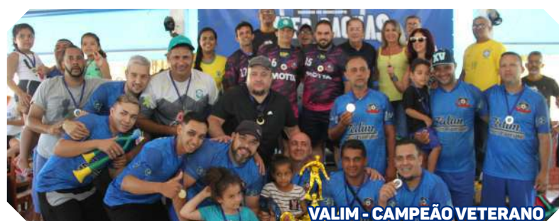
VALIM - CAMPEÃO VETERANO