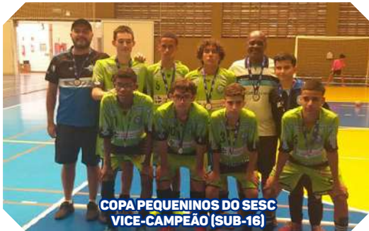
COPA PEQUENININOS DO SESC VICE-CAMPEÃO (SUB-16)