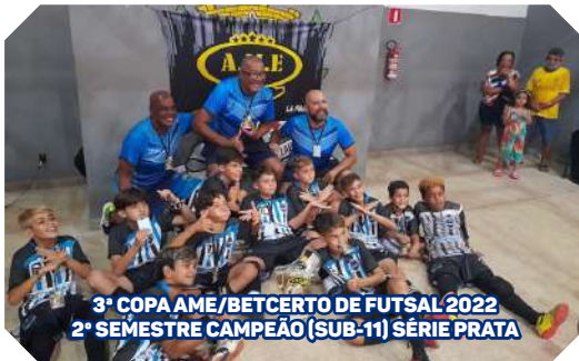
3ª COPA AME / BETCERTO DE FUTSAL 2022 2º SEMESTRE CAMPEÃO (SUB-11) SÉRIE PRATA