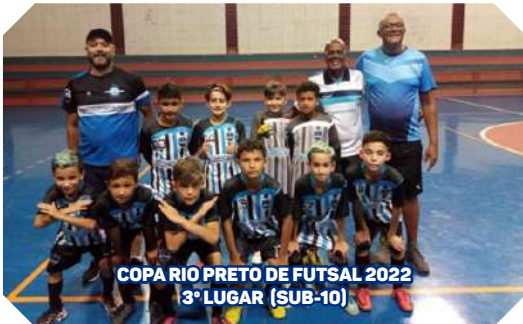
COPA RIO PRETO DE FUTSAL 2022 3º LUGAR (SUB-10)