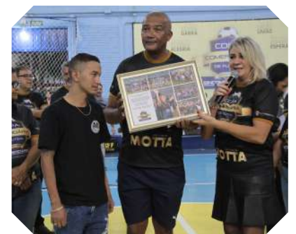
Homenagem à equipe Rei dos Parafusos