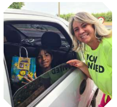
As crianças foram recebidas com mimos nos clubes de lazer