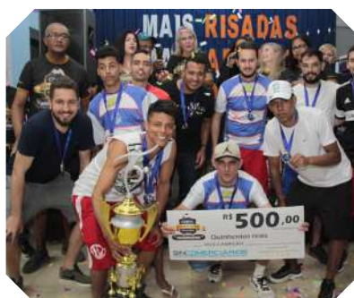
Alushop - vice-campeão série prata