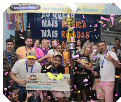
GPM - vice-campeão série ouro