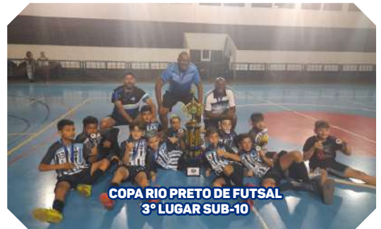
COPA RIO PRETO DE FUTSAL 3º LUGAR SUB-10

TRAGA O SEU FILHO PARA SER UM CRAQUE EM NOSSAS ESCOLINHAS