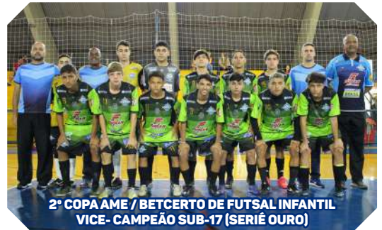
2ª COPA AME / BETCERTO DE FUTSAL INFANTIL VICE-CAMPEÃO SUB-17 (SÉRIE OURO)