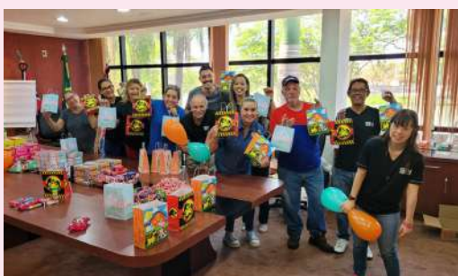
Funcionários fizeram a montagem dos kits surpresas na sede administrativa

O Dia das Crianças (12/10) foi incrível. A garotada foi recebida com sacolinhas surpresas nos nossos clubes de lazer para deixar a data ainda mais especial.