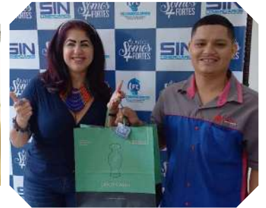
Papais premiados em sorteio retiraram presentes no Centro de Benefícios