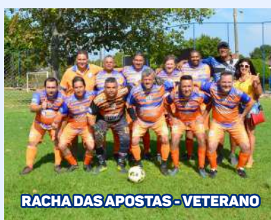
RACHA DAS APOSTAS - VETERANO