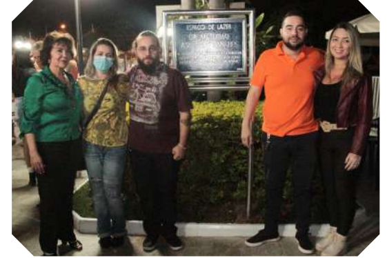
Diretoria, funcionários e comerciários marcaram presença na inauguração