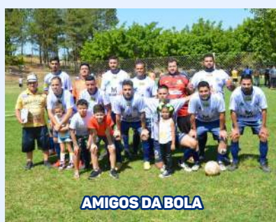
AMIGOS DA BOLA