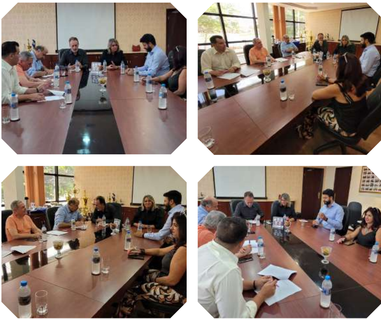
Reuniões com o patronal foram realizadas na Sede administrativa para tratativas em relação a CCT

As demais cláusulas econômicas, como pagamentos de feriados, também foram reajustadas em 8,83%.