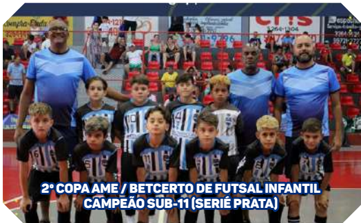
2ª COPA AME / BETCERTO DE FUTSAL INFANTIL CAMPEÃO SUB-11 (SÉRIE PRATA)